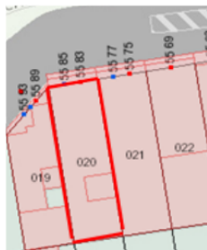
NOMENCLATURAS CATASTRALES PRINCIPAL: CL 45A SUR No 55-83 SECUNDARIA: CL 45A SUR No 55-85