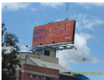
SENTIDO NORTE-SUR DE LA VALLA COMERCIAL