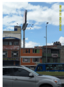
FACHADA DEL PREDIO